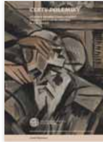
Luboš Merhaut Cesty polemiky FF UK 2021, 475 s.

Cílem monografie s podtitulem Význam a proměny žánru polemiky v české literatuře na přelomu 19. a 20. století je představit polemiku jakožto svěbytný přesvědčovací a rétorický útvar. Autor ji vidí nejen coby formu debaty, ale také jako způsob, jak pokořit a zsměšnit protivníka. Ve sledovaném období jsou polemiky a osobní útoky vskutku vyostřenější než v současném literárním prostředí. Polemika je však také nazírána jako samoučelná parazitní forma diskuse, která může být spíše překážkou na cestě k „pravdě“ než prostředkem jejího hledání. Ustavení žánru jde ruku v ruce s literární kritikou – také ta získala na vážnosti a přestala být přehlíženou disciplínou teprve v devadesátých letech 19. století. Nejžurnivější spory se přitom literatury týkaly jen okrajově: například při hodnocení odkazu Jana Nerudy bylo hlavním motivem to, že byl „vlažný křesťan“ a útočil na katolictví. Podobně je na řadě vzpomínek Jiřího Karáska ze Lvovic doloženo, že proslulé polemiky mezi Arnoštem Procházkou a F. X. Šaldou měly kořeny v osobních antipatiích a snaze ovládnout Literární listy. V teoretické rovině je nosný Merhautův pojem „paměť polemiky“. Polemika se vnitřně vrství, stává se svým vlastním předmětem a dochází k jejímu zacyklení. Předností knihy je i zasazení žánru do širokého společenského kontextu s návazností na literární život či dobový rozmach časopisů. Pro literární badatele je cenný i přehled devadesáti polemických kauz probíhajících v letech 1886 až 1914.